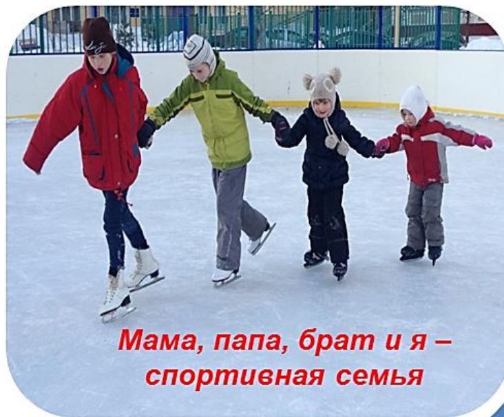
Мама, папа, брат и я – спортивная семья

Правило нашей семьи: «Если хочешь воспитать своего ребенка здоровым, сам иди по пути здоровья, иначе его некуда будет вести!».