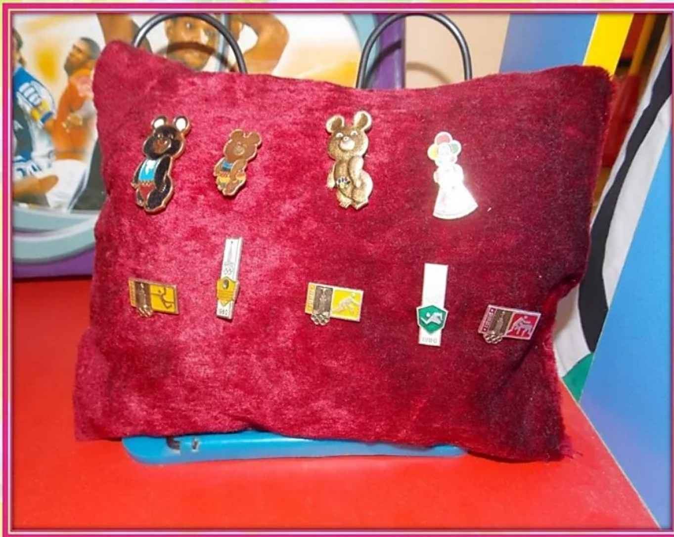
«Коллекция олимпийских значков»