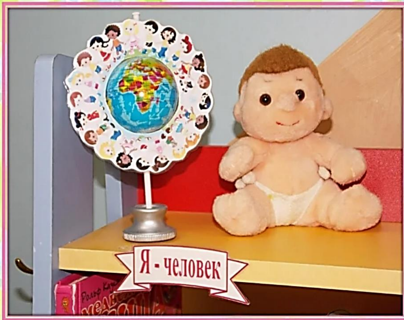
«Я – человек»