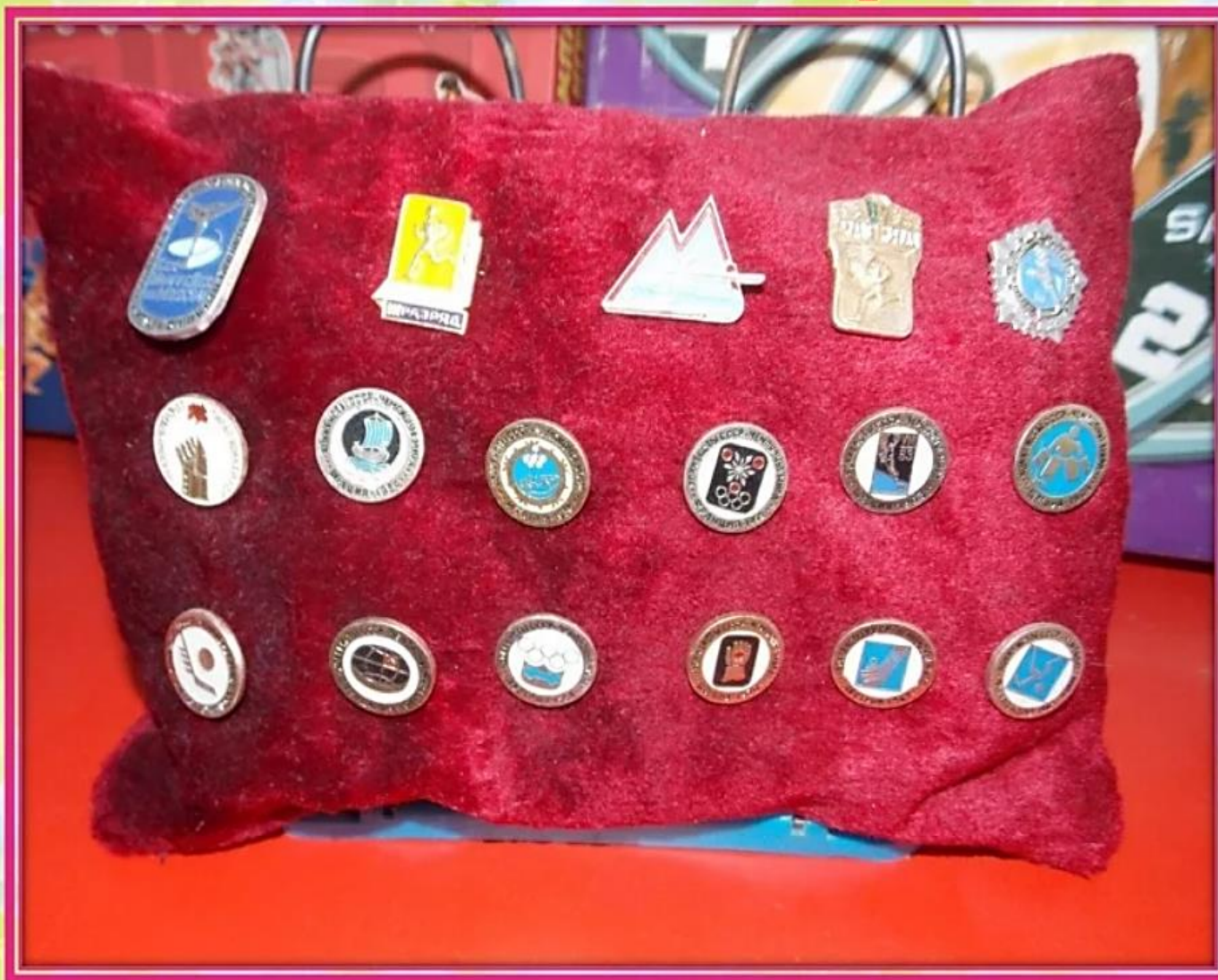
«Коллекция спортивных значков»