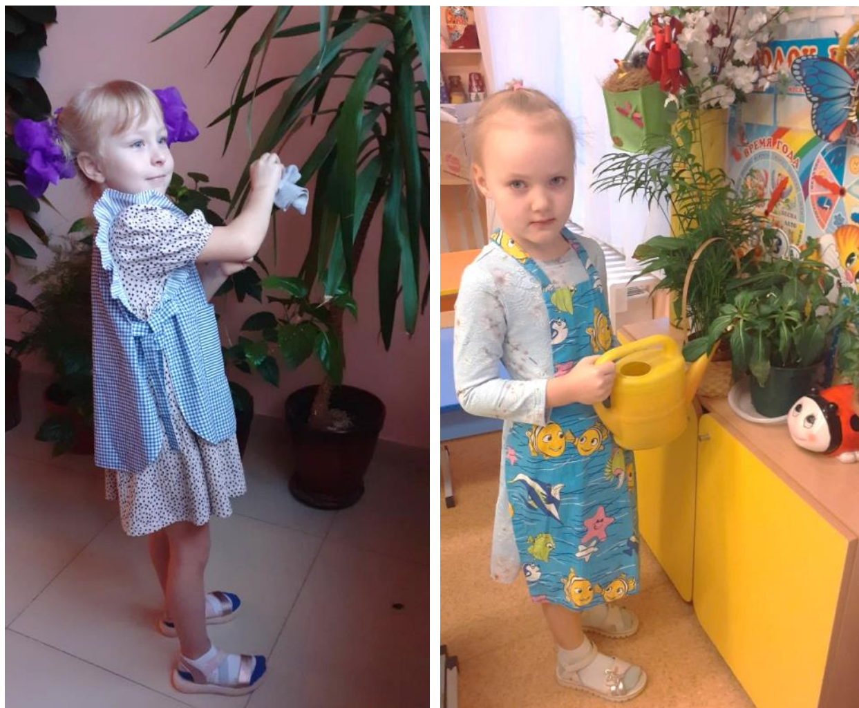
Уход за комнатными растениями

В течение всего года дети выполняют ежедневные поручения воспитателя. Приобщая детей к труду в уголке природы, воспитатель объясняет им трудовые действия. Периодически осматриваем вместе с детьми комнатные растения - так ребята приучаются замечать изменения. Например, появился новый листок у фикуса, зацвела герань, поникли листочки.