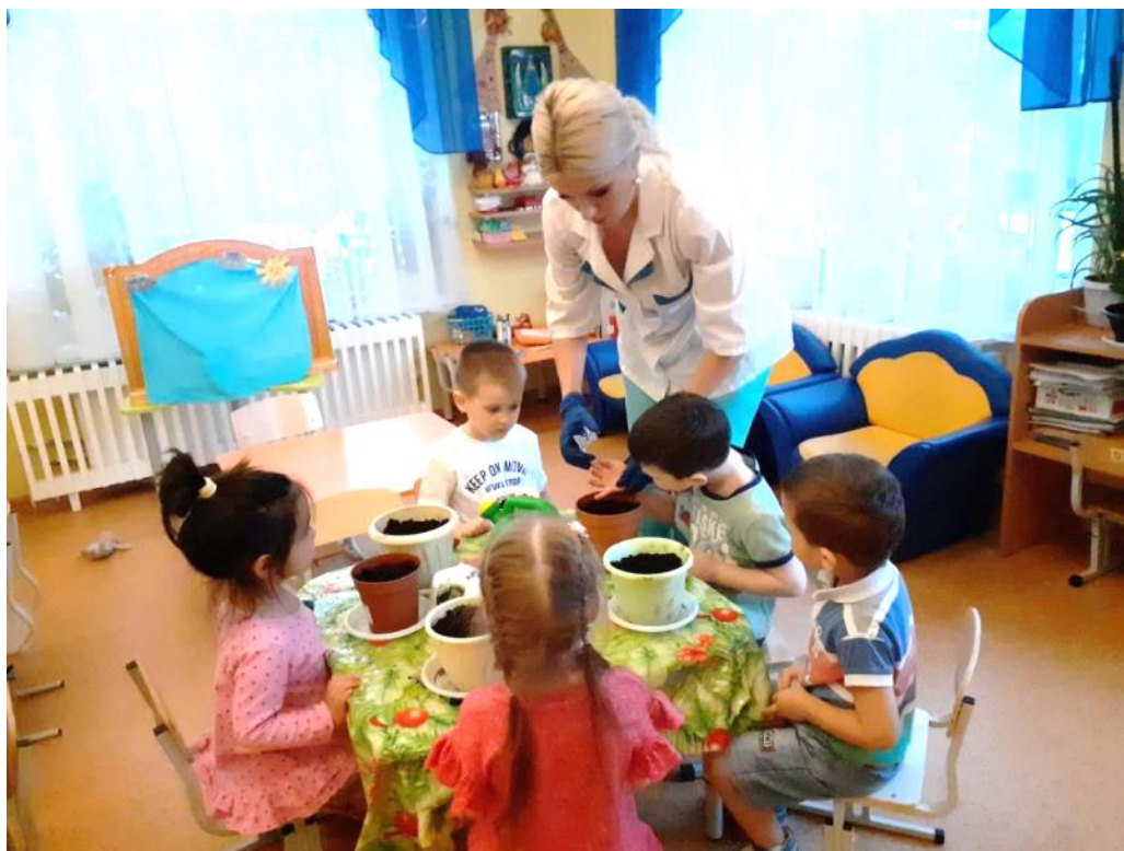
Выращивание растений из семян

Проект направлен на приобщение детей к труду в природе, воспитание бережного отношения к растениям и развитие умений заботиться о них.