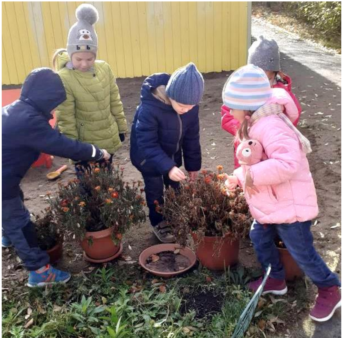
Осенью привлекаю детей к сбору семян ноготков, бархатцев