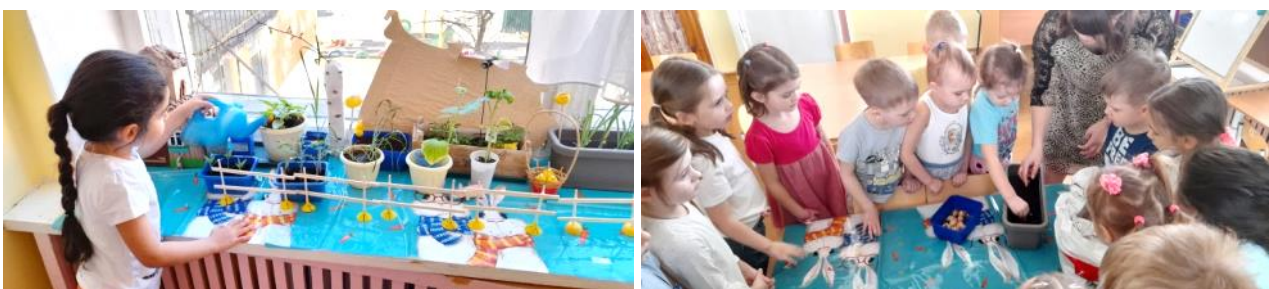
Посадили и поливают лук на подоконнике, чтобы и зимой употреблять полезные листовые овощи.