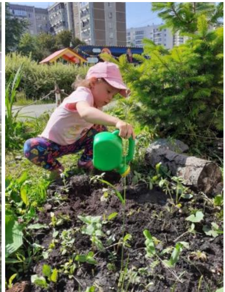
Летом знакоблю детей с такими видами ухода за растениями, как полив, рыхление, прополка культурных растений от сорняков