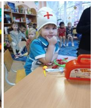
Дети средней группы играют в настольные и в сюжетно-ролевые игры «Больница», «На приёме у доктора»