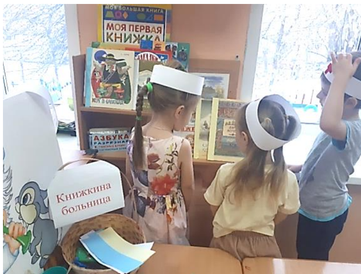
Для вылеченных книг санаторий находится на одной из книжных полок.

Но он еще слаб, плохо выглядит. Врачи рекомендуют поехать в санаторий. Санаторий нужен этому больному, чтобы окончательно выздороветь.