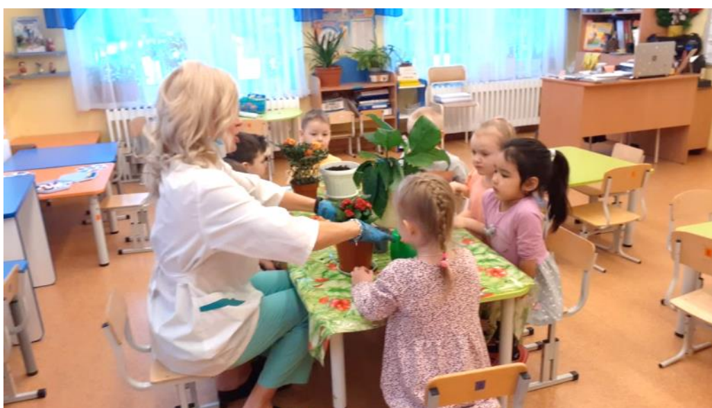
Пересадка комнатных растений