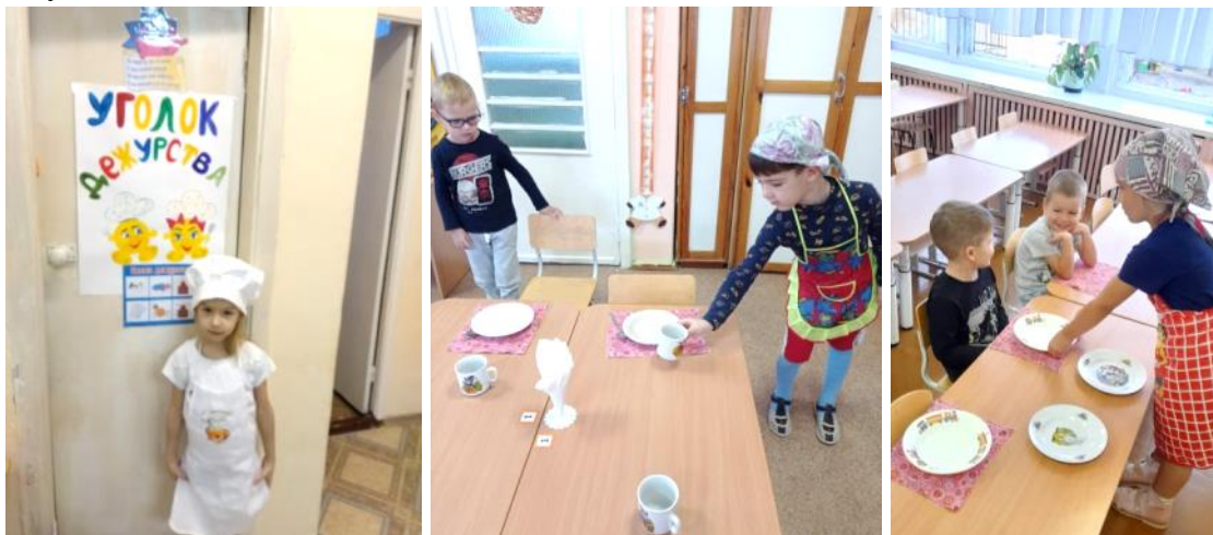
Дети сами накрывают на столы, готовят материал к занятиям.

После экскурсии по детскому саду дети стали помогать в группе воспитателю и младшему воспитателю.