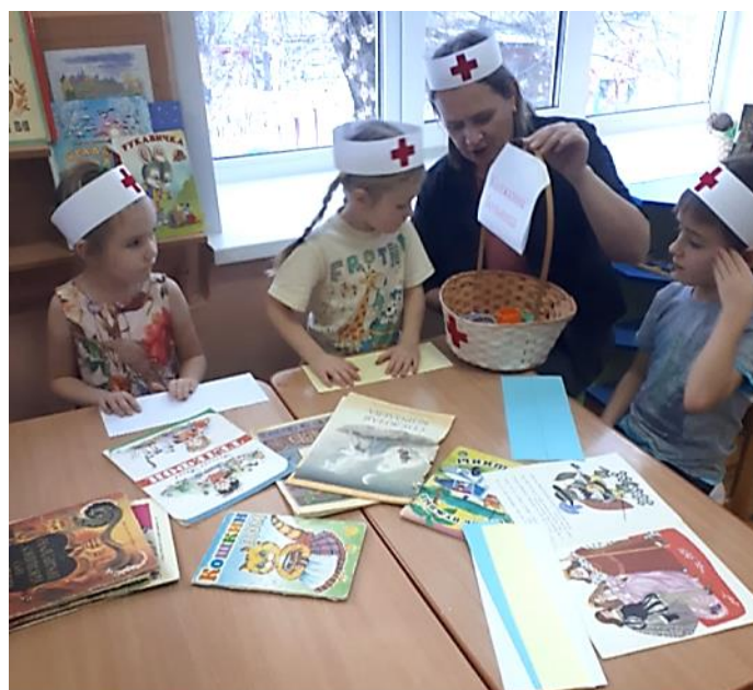
Выбор инструментов и лекарств для лечения книг: клей, скотч, бумага, ластик и т.д.

Ребята внимательно слушали главврача о том, как нужно лечить больных «пациентов», а затем с большой ответственностью принялись за дело – лечить заболевшие книжки.