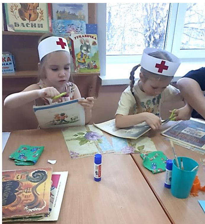
Дошкольники легко и непринуждённо пользуются ножницами, клеем, широким скотчем, справляясь даже с починкой плотного переплёта.

Ручной труд значительно расширяет кругозор детей, обогащает их знания о свойствах материалов и возможностях их применения.