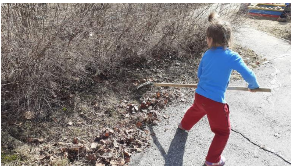
Уборка листьев, камней и сорняков на клумбах