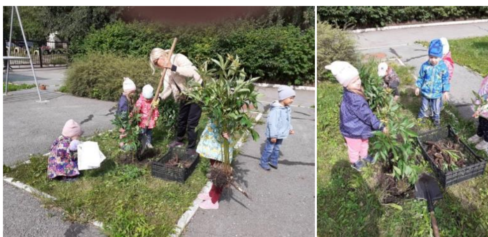
Пересадка пионов. Здесь мы решили разредить куст ...