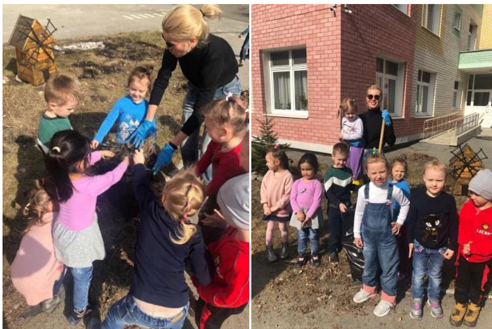
Весной обязательно органирую совместный труд по уборке участка