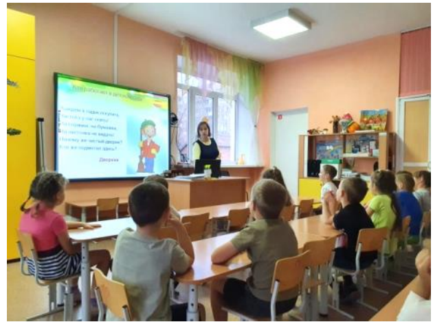
Беседа с воспитанниками «Что такое детский сад»