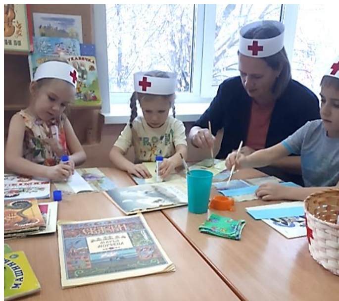
Ребята клеивают оторванный лист на место в книгу.

Ручной труд значительно расширяет кругозор детей, обогащает их знания о свойствах материалов и возможностях их применения.